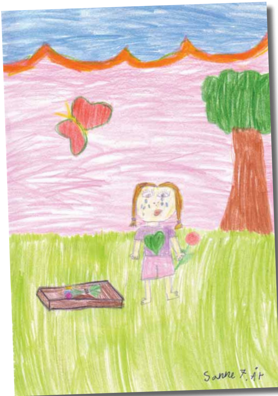
Les Sannes fortelling på side 8-10