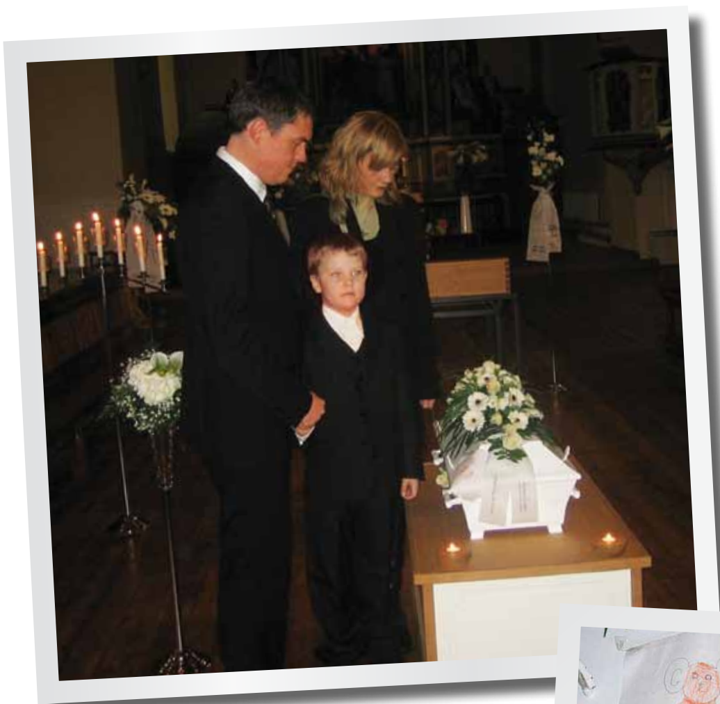
Storebror i begravelsen